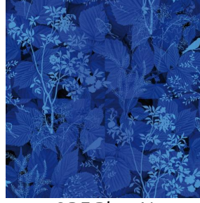
ODE Bleu 41