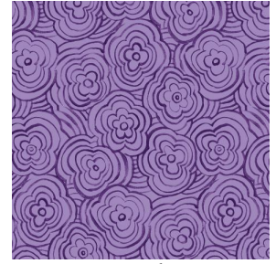
ONDES Violine 105