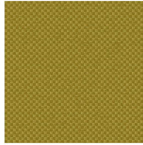
CHARLOTTE Mousse 92