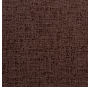
MURA TERRE 107 Druck design