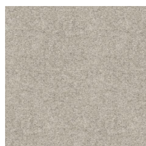
ELAINA Naturel 26