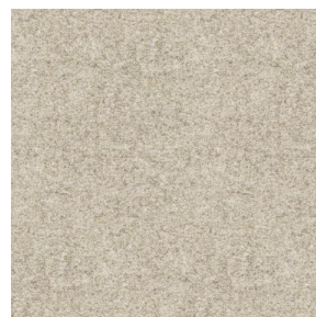
ELAINA Lin 11