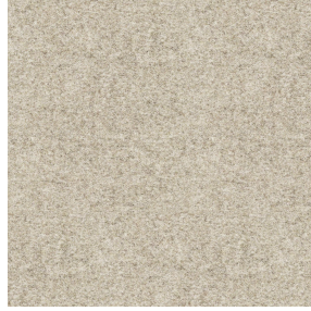
ELAINA Lin 11 Druck design