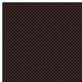
CHARLOTTE Ebene 124