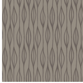
YENDI Terre 107 Druck design