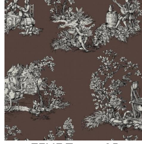
ZELIE Taupe 95