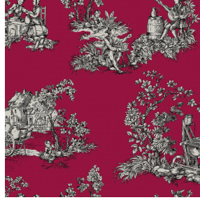
ZELIE Rubis 59 Druck design