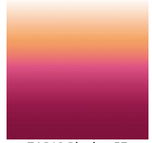
ZADIG Pivoine 57