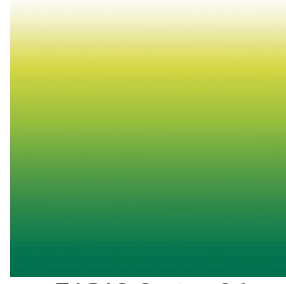
ZADIG Cactus 36