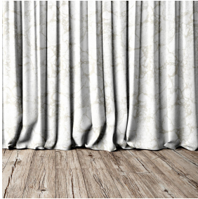
CARRARA Chamois 111 Druck design