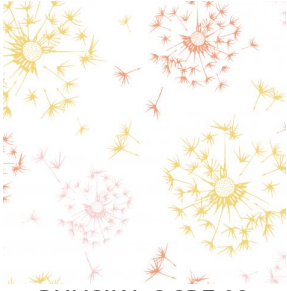
PUNSIKA OCRE 03