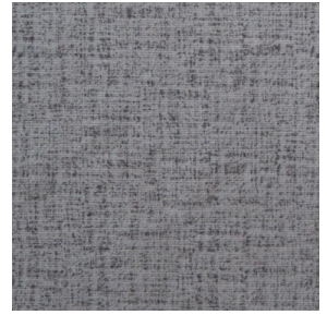
MURA MINERAL 157