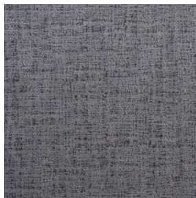
MURA ETAIN 180