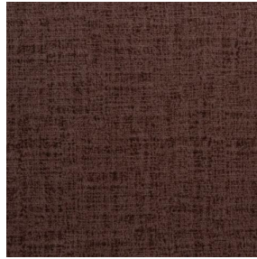
MURA TERRE 107