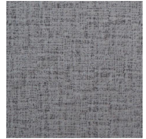
MURA MINERAL 157