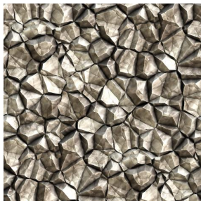
SAPHIR Naturel 26