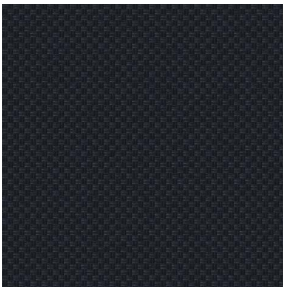
CHARLOTTE Noir 10