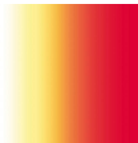
ZENITH Agrume 69