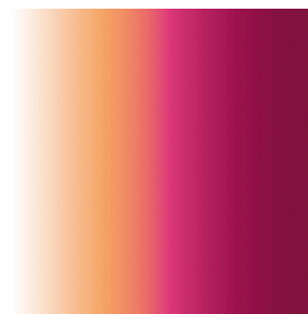
ZENITH Pivoine 57