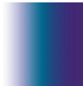
ZENITH Bleu 41