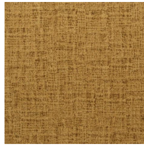
MURA SAVANE 185