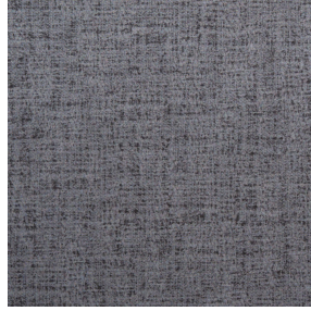
MURA ETAIN 180 Druck design