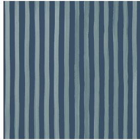
SONG Titanium 98 Druck design