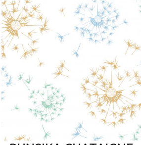
PUNSIKA CHATAIGNE 55