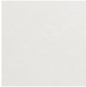
LY Blanc 01 Druck-Trägergewebe