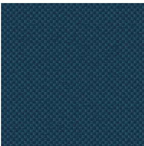
CHARLOTTE Océan 91