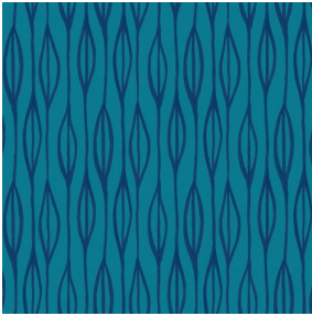
YENDI Pacifique 54