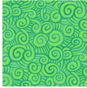
TUMULTE Prairie 125