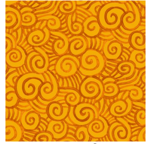
TUMULTE Safran 49