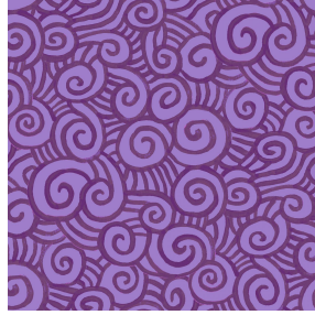
TUMULTE Lilas 19 Druck design