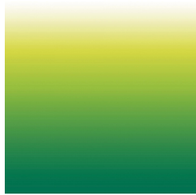
ZADIG Cactus 36 Druck design