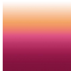
ZADIG Pivoine 57