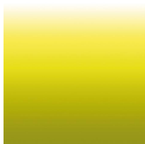
ZADIG Anis 62