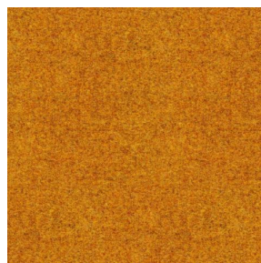
ELAINA Ocre 03