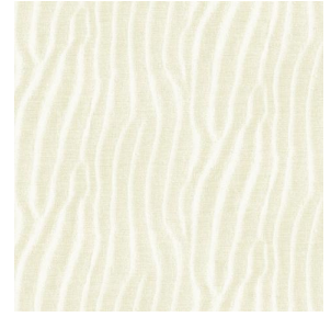
SABLE Ivoire 115