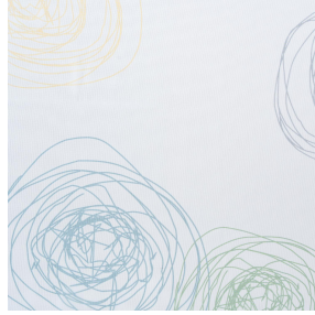
NAHIA TURQUOISE 53 Druck design