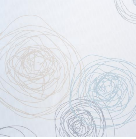
NAHIA OR 94