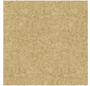
ELAINA Beige 63