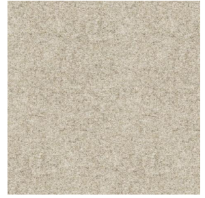
ELAINA Lin 11