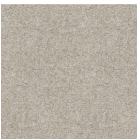
ELAINA Naturel 26