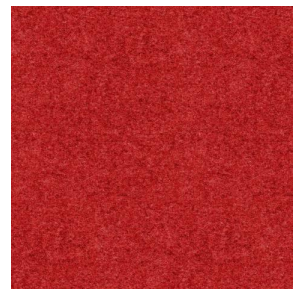
ELAINA Rouge 21