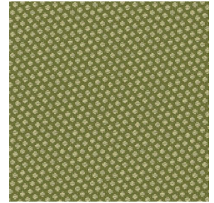
GONIDIE Mousse 92