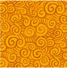
TUMULTE Safran 49