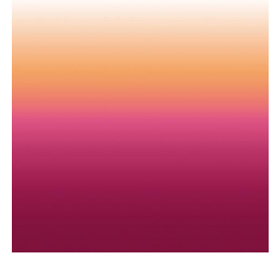
ZADIG Pivoine 57