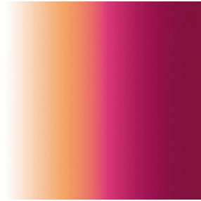
ZENITH Pivoine 57 Druck design