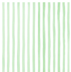
SONG Tilleul 103