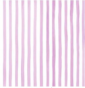
SONG Framboise 81