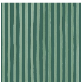
SONG Sapin 126