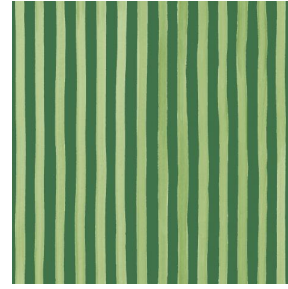
SONG Lierre 124