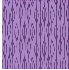
YENDI Lilas 19