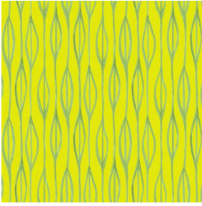
YENDI Anis 62