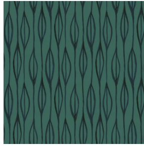
YENDI Sapin 126