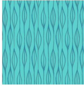
YENDI Lagon 110