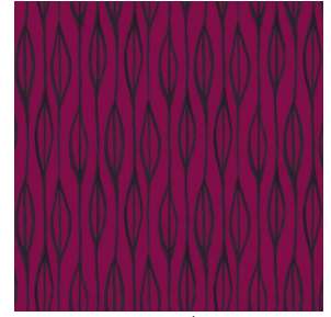
YENDI Opéra 104