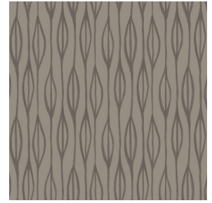
YENDI Terre 107