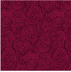
ONDES Opéra 104