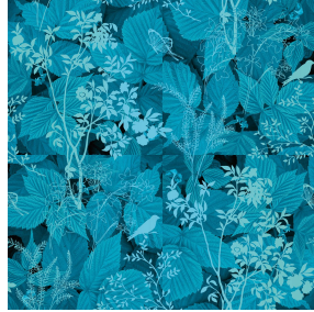
ODE Turquoise 53 Druck design