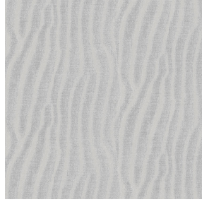
SABLE Souris 31 Druck design