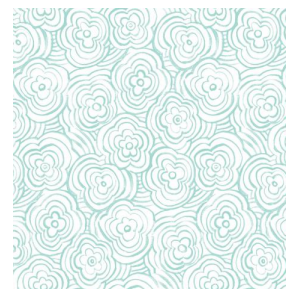
ONDES glacier 43