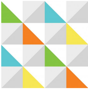
VICTORIEN multico 98