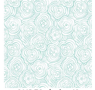
ONDES glacier 43