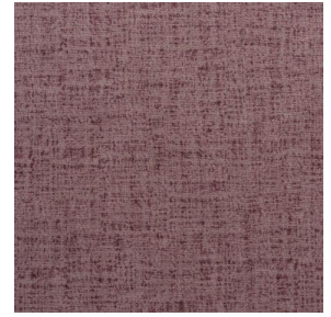
MURA ROSE 129