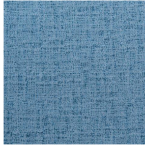
MURA GLACIER 43