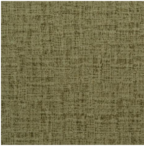
MURA OLIVE 61