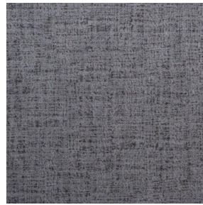
MURA ETAIN 180