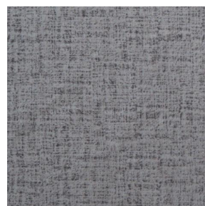
MURA MINERAL 157