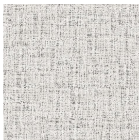
MURA MASTIC 48