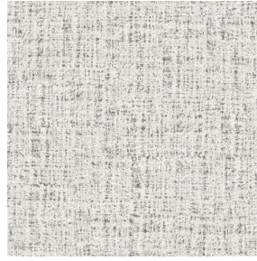
MURA MASTIC 48