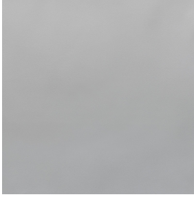
BELORA BPI 00 Druck-Trägergewebe