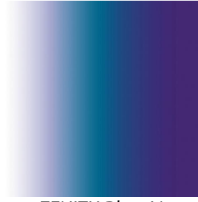
ZENITH Bleu 41