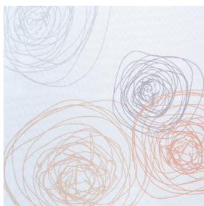
NAHIA CURRY 184