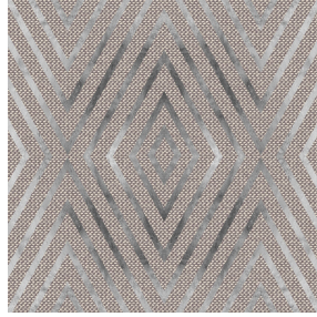
ECHO Lin 11 Druck design