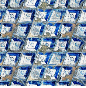
CLEMENTINA Azur 137